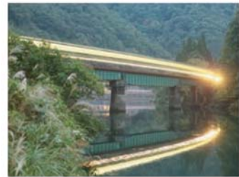
写真は20枚程度、鉄道部品はタブレット、汽笛、行き先版(5枚程度)、切符切りなど展示予定です。