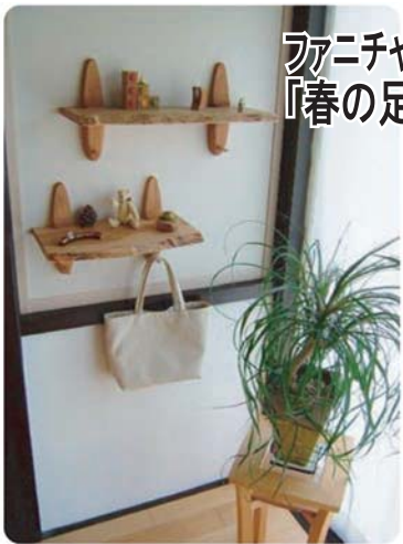
アニチャースタジオ noco 作品展 『春の足音 ～木・布・羊毛～』