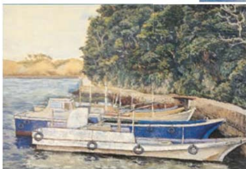
安井弘年 ファミリー展