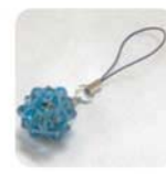
10/31 レッスン内容 30個のビーズボール

日時：10月31日(水) 10:00～12:00 11月4日(日) 10:00～12:00 場所：予約席 参加費：2000円(飲み物付)