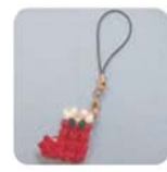
11/4 レッスン内容 クリスマスブーツ