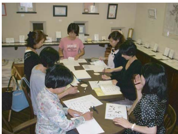
9月23日に行なわれた、「ひらがな教室」の様

「ひらがな」の歴史に始まり、 筆の持ち方・使い方、 そして文字を書く時の姿勢など、 細かく丁寧な説明がされていて 大変充実した教室でした。