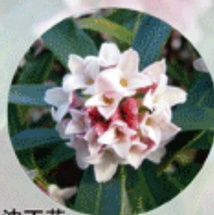
沈丁花 じんちょうげ