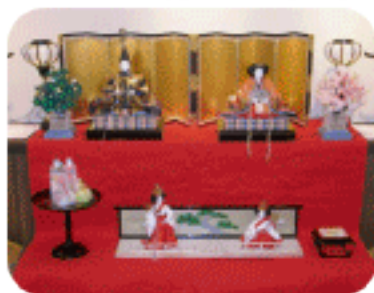
※お雛様展で展示できる作品やグッズがありましたらお寄せ下さい。